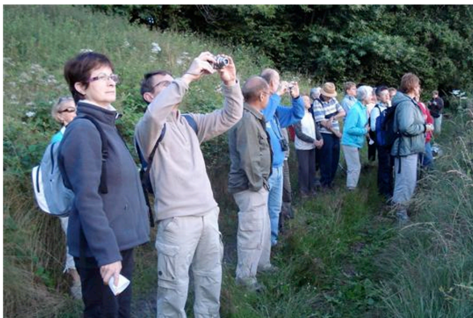
Il est 5 h 50, le soleil se lève.

le 29/06/2012 à 05:00 par Jean-Claude PIERRAT (CLP) Vu 27 1